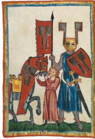
Niño entrenando para convertirse en caballero

Su entrenamiento para convertirse en caballeros comenzaría a una edad temprana. Dejarían su hogar para vivir con un amigo de la familia o pariente que hubiese aceptado entrenarlos. En los primeros años de entrenamiento, ayudarían a vestir y a servir al lord, y se los conocería como pajes . Durante estos años iniciales como aspirantes a caballeros, probablemente aprenderían a usar una espada, a montar a caballo y a empuñar una lanza, que es un largo poste de madera con punta metálica. Más adelante, cuando estuviesen listos para aprender