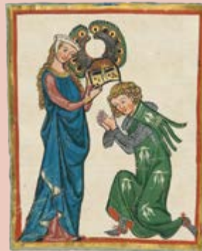
Se esperaba que un caballero cuidara y protegiera a los miembros más débiles de la sociedad.

En Francia, en los siglos XII y XIII, surgieron ciertas expectativas sobre cómo debían comportarse los caballeros en la sociedad. El término gallardía , que se refiere a un jinete guerrero o caballero, se convirtió en la palabra utilizada para describir estas expectativas. Las ideas de gallardía se difundieron a otros países europeos. Se esperaba que los caballeros sirvieran a