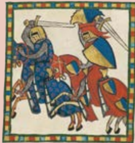
Los caballeros debían ser valientes en las batallas.

su lord. Tenían que honrar y proteger a la Iglesia y a los miembros más débiles de la sociedad. También debían tratar a otros caballeros capturados en combate como invitados de honor hasta que se recibiera un rescate. A veces, transcurrían meses hasta que la familia de un caballero capturado pagaba y una vez recibido un pago, este caballero era libre de marcharse.