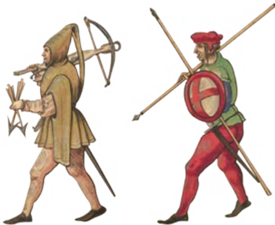
Ballesteros y piquero

En la Edad Media, a los soldados de infantería comunes se los entrenaba para luchar con un hacha y una lanza larga, llamada pica. A otros se los entrenaba para ser arqueros y ballesteros expertos. Algunos soldados de infantería usaban cotas de malla, una forma inicial de armadura metálica, pero la mayoría tenía recubrimientos acolchados y dagas. Sin embargo, los soldados más estimados eran los caballeros.