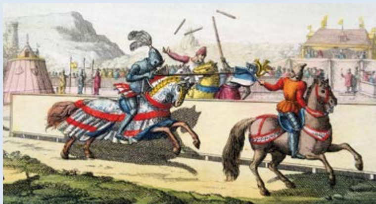
Caballeros compitiendo en una justa