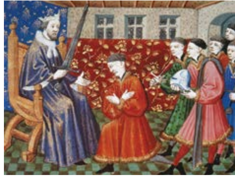
Un rey nombrando caballero a un escudero

A los escuderos exitosos, el lord podía nombrarlos caballeros. En lo que se conocía como la ceremonia de investidura, el lord les daría un golpecito en el hombro con la parte plana de su espada. Luego, un sacerdote podría bendecirlos con una plegaria.