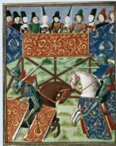
Las justas eran un deporte popular.

un día de emoción y entretenimiento, algo así como ver un partido de fútbol americano o béisbol en la actualidad. Cuando comenzaban las justas, los caballeros se embestían y, con la ayuda de una lanza, trataban de derribar de su caballo al oponente.