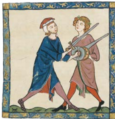
Los escuderos aprendían a luchar con espadas.

Aunque seguirían siendo sirvientes, como escuderos ahora serían responsables de preparar y ensillar los caballos del lord. Además, estarían a cargo de limpiar y lustrar su armadura. Aprenderían a luchar montados a caballo y a usar otras armas, incluida una lanza más pesada. Esta parte de su entrenamiento duraría varios años.